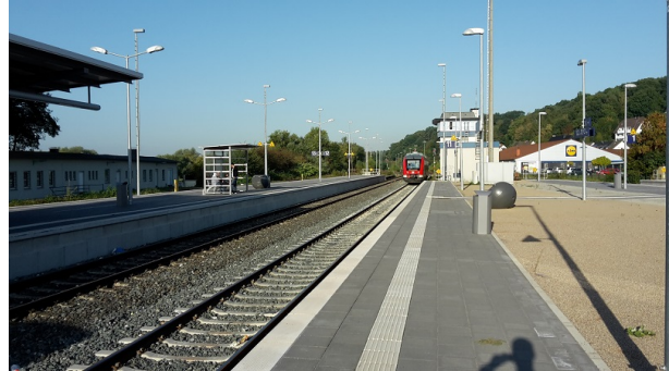
Ansicht Bahnsteig 11 + 12/13