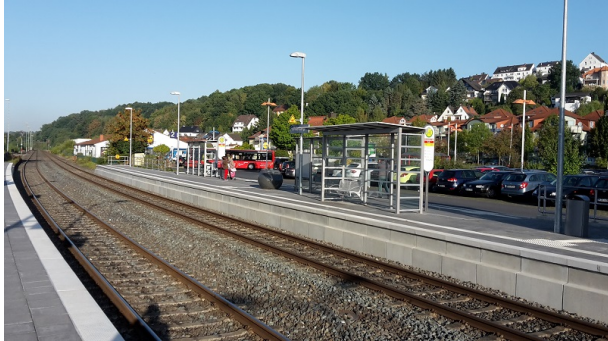
Bahnsteig 2 Wetterschutzhaus