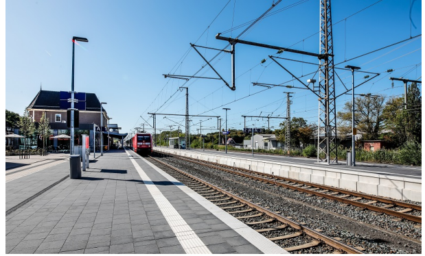
Ansicht Bahnsteig mit taktilem Leitsystem