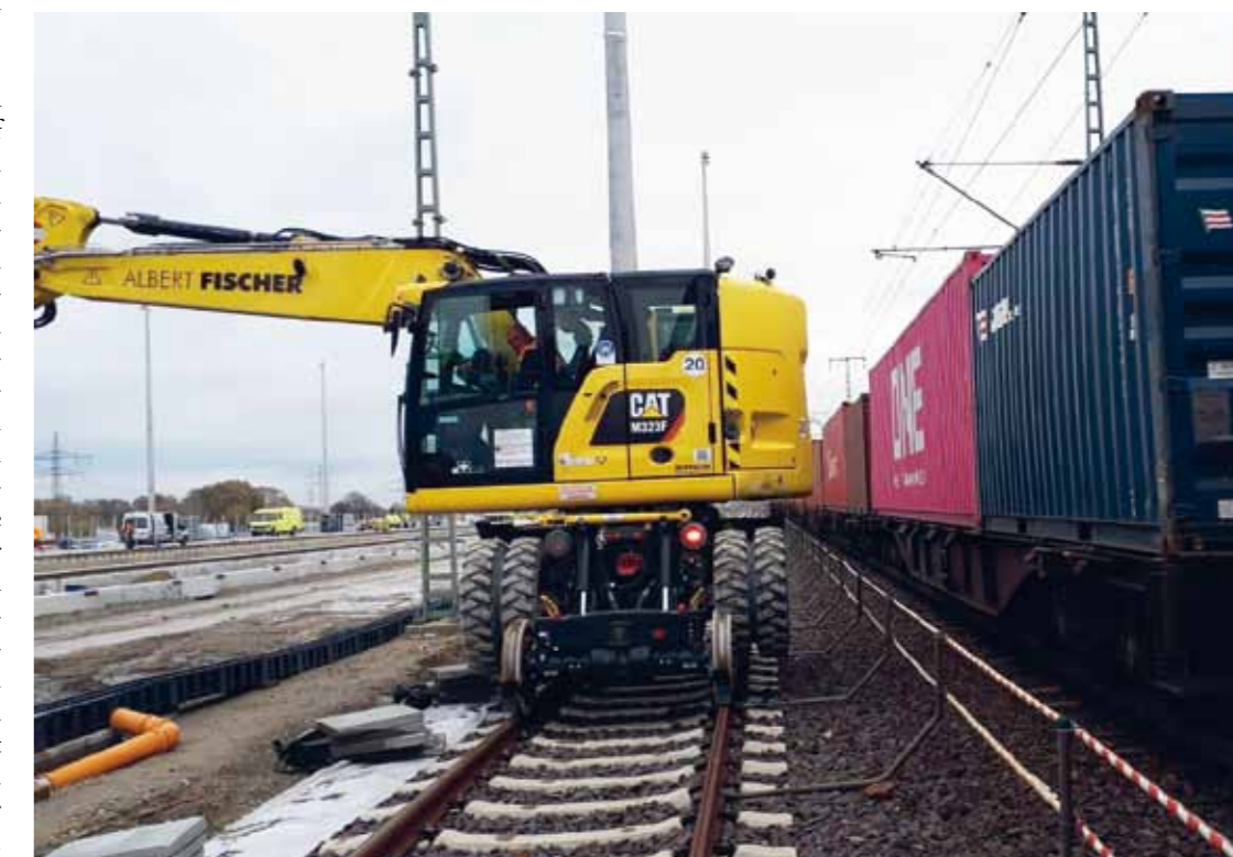
Selbst Arbeiten während des Zugbetriebs am Nachbargleis im Lichtraumprofil stellen aufgrund der Kurzheckbauweise des Cat M323F keine Einschränkung dar.