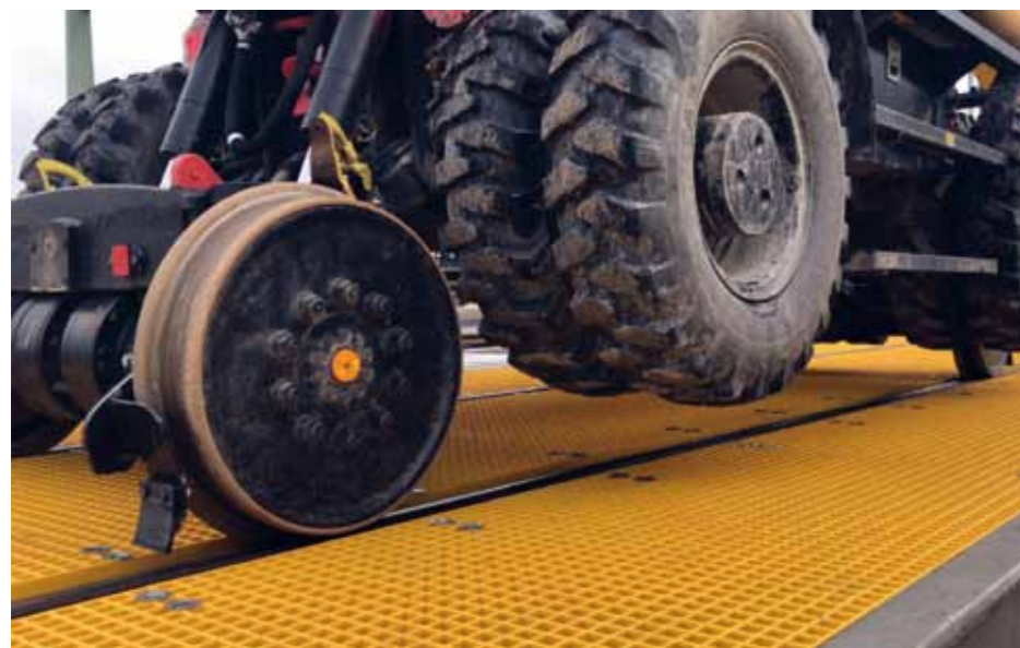
Dank des hydrostatischen Schienenantriebs an beiden Gleissachsen treiben hydraulisch betriebene Motoren die Schienenführungsrollen bei dem Zweibegebagger an. Daraus resultiert eine hohe Bodenfreiheit.