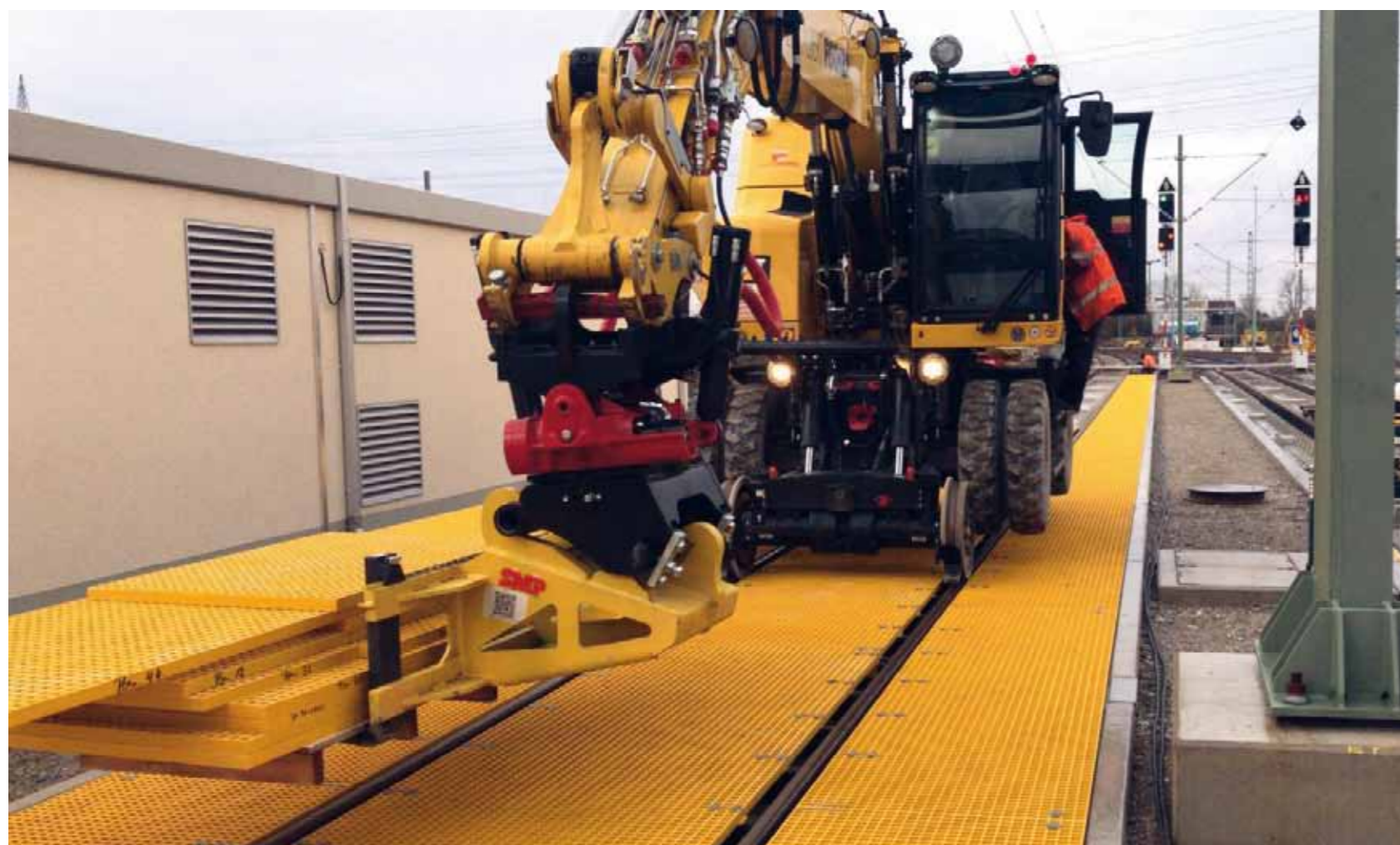
Gitterroste werden verfahren.