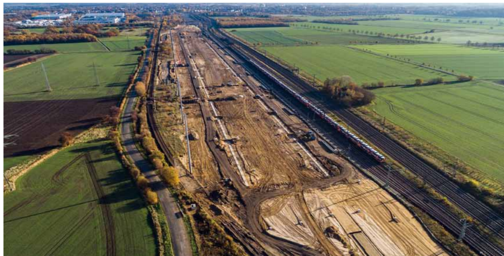
Ein Blick aus der Vogelperspektive in Richtung MegaHub Lehrte von 2019.