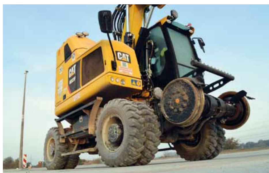
Nicht nur auf den Gleisen ist der Zweibegebagger auf der Großbaustelle unterwegs.