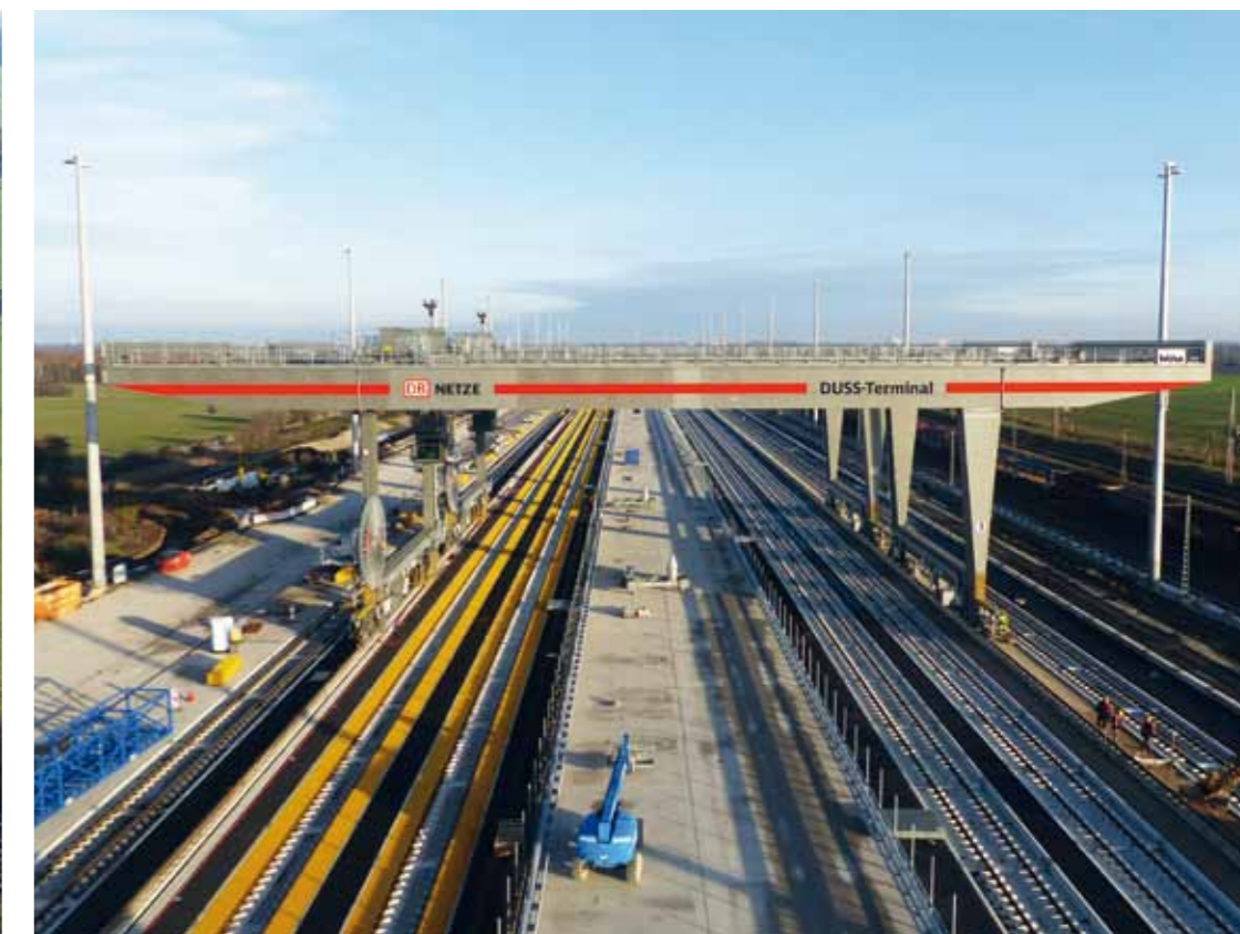
Auf Augenhöhe mit dem Portalkran bei der Kranbegehung am MegaHub Lehrte: Der Inbetriebnahme-Prozess für die drei Portalkrane ist in vollem Gange.