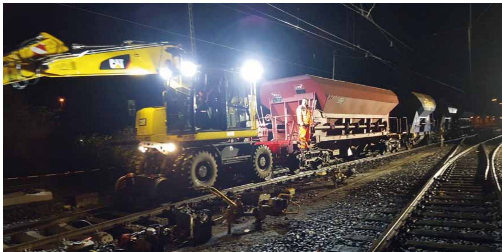
Bis zu drei Waggons gleichzeitig mussten mit dem Zweibegebagger gezogen werden.